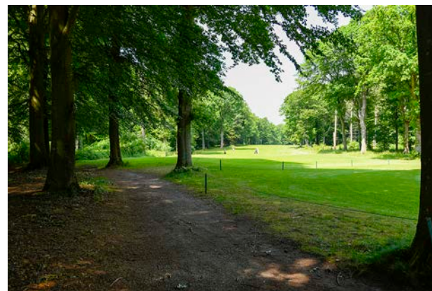
4. Golfbanen i Munkebjerg Skov.