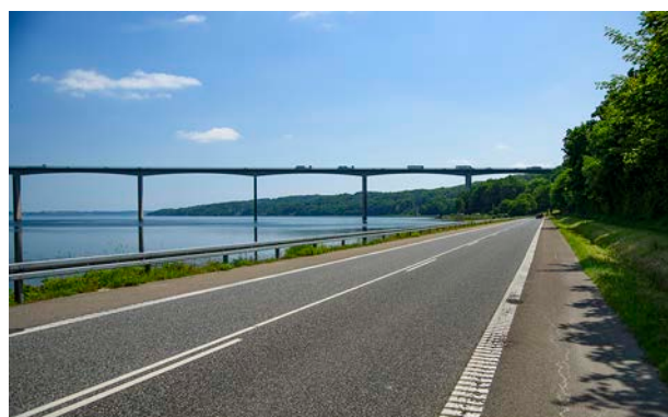
1. Vejle Fjordbroen og Ibæk Strandvej set mod øst.