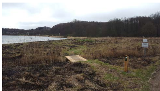
11. Kig over strandeng og sommerhuse fra Saltbækvej.