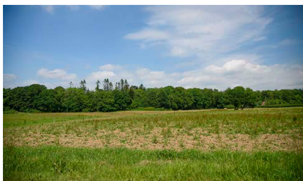
10. Kig ind mod landskabsområdet, hvor et markant skovbryn afgrænser området.