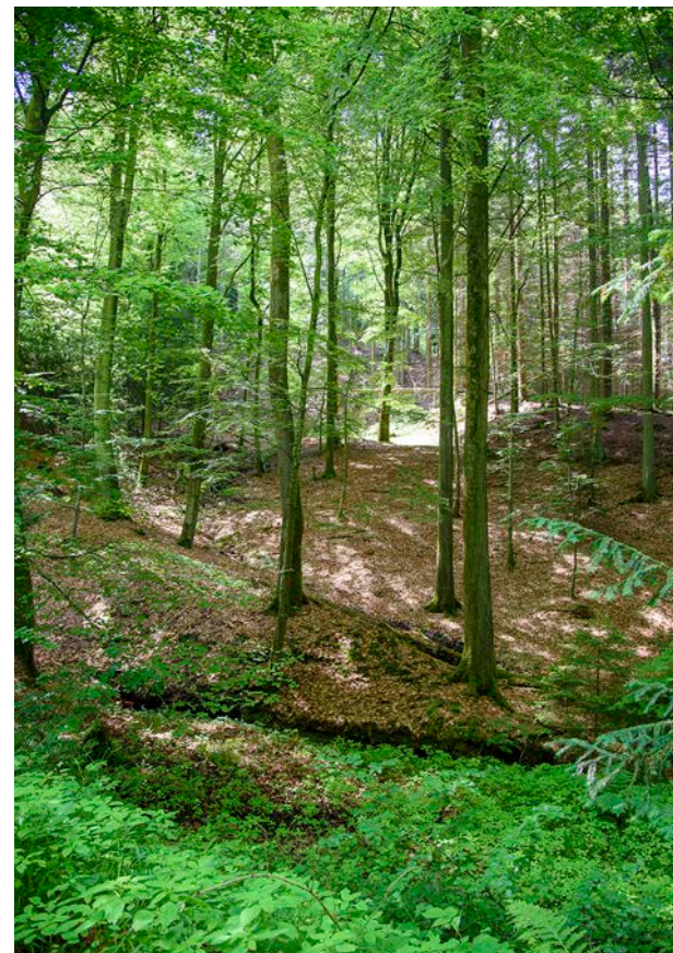
9. Kuperet skov omkring Munkebjerg Hotel.