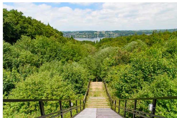
7. Udsigt fra trappen ved Munkebjerg Hotel med skovens fald mod fjorden.