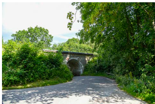
3. Jernbanen gennemskærer hele området, men ligger relativt skjult. Man ser den, når man krydser den.