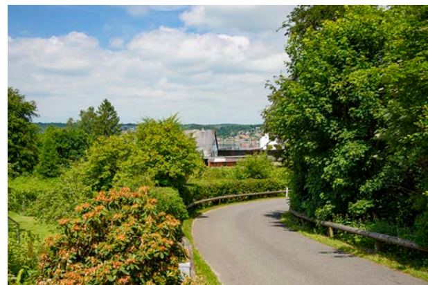
5. Der er et lille kig ud over fjorden fra Ibækvej.