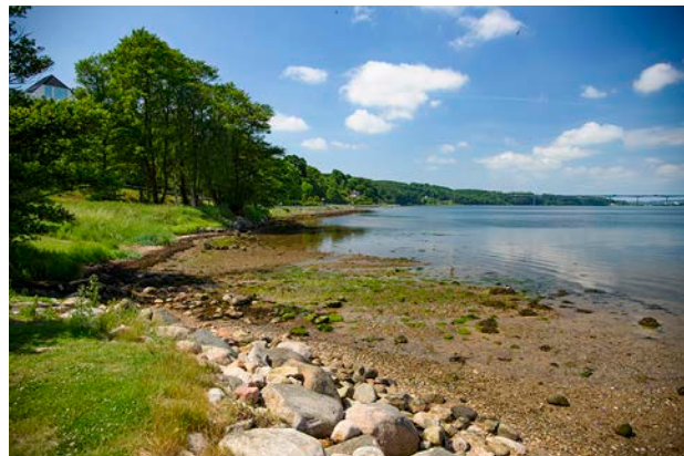
2. Kig mod Vejle og Vejlefjordbroen fra Ibæk Strandvej. Forrest i billedet ses Ibækkens udløb i fjorden.

Skovene langs kysten kan erkendes tilbage på meget gamle kort, bl.a. på kortblade fra Videnskabernes Selskab fra 1789. Luftfoto fra 1954 vidner dog om, at mange parceller har været underlagt landbrugsdrift.