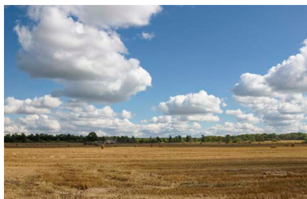
3. Den østlige del af området har mere landbrugspræg.