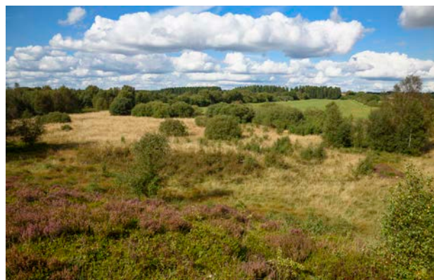
1. Indlandsklitten - den lyngklædte bakkekam.