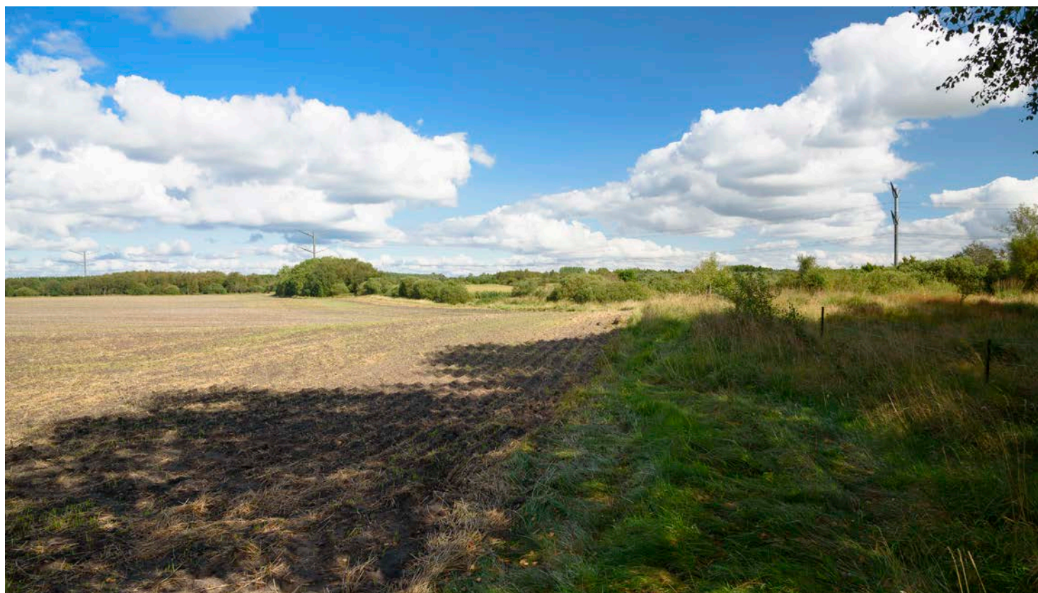
4. Mod øst løber højspændingsledninger i nord-syd-gående retning.