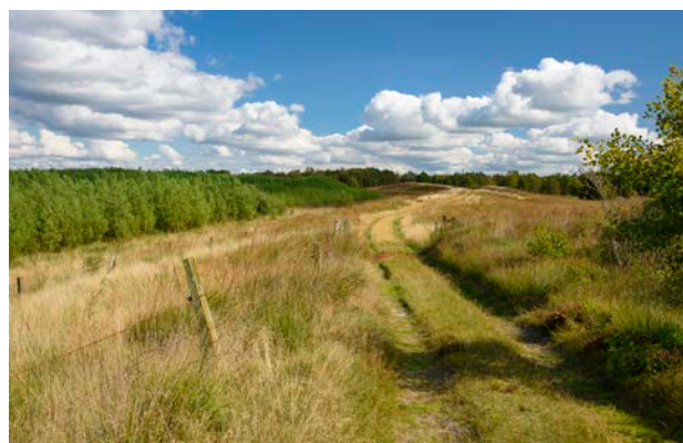
2. Udsynet sløret af energipil.

Mod øst gennemskæres området af et ledningstracé.