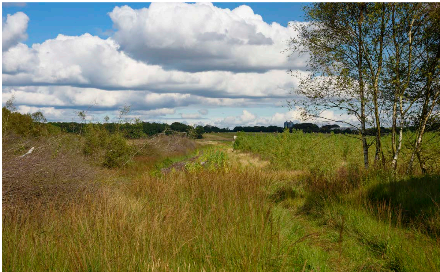
6. Vildtremiser og energipil i mosebunden. På hedesletten i baggrunden ses landbrugssiloer i horisonten.