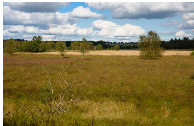
5. Kig over den flade mosebund, hvoraf en del er opdyrket. Hedesletten, som ses i baggrunden af fotoet, anvendes til intensivt landbrug.

Landskabet er præget af den langstrakte indlandsklit, som giver et forholdsvis godt udsyn over det omkringliggende flade landskab. De nord-syd gående moselodder ligger tydeligt i landskabet, og hele mosen er flankeret af intensiv landbrugsproduktion. Moselodderne er flere steder under tilgroning eller tilplantet med energipil eller vildtremisser, hvilket slører udsynet fra klitten. Længere mod øst udviskes de tydelige strukturer i landskabet, og landbrugsproduktionen sætter et tydeligt præg. Den østlige del af området gennemskæres af et ledningstracé, og området har ikke samme visuelle ro.