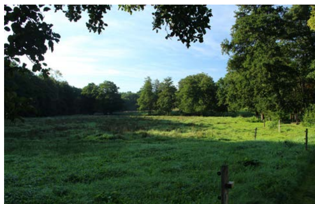
3. Udsigt over den nordlige del af ådalen fra Børkop Mølle