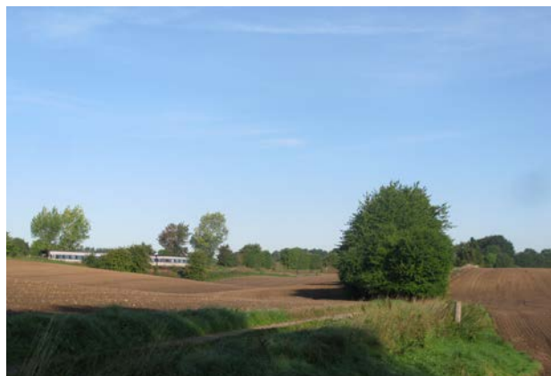
6. Jernbanen følger i store træk kanten af ådalen. Synlig her på grund af tog.

Landskabets skala er lille, med smalle veje og små ældre bebyggelser.