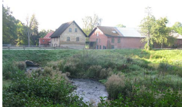
5. Brøndsted Mølle