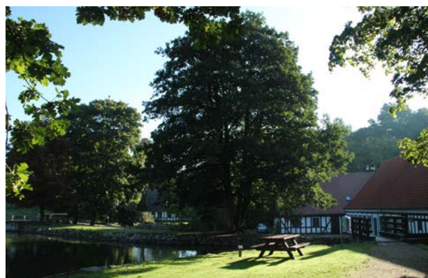
4. Børkop Mølle med den bevarede mølledam