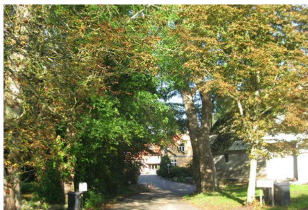
7. Gadebilledet i Brøndsted er præget af store kastanietræer