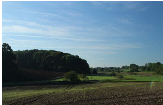
2. Ådalen set fra Fiskebækvej mod syd

Landsbyen Brøndsted er stjerneudskiftet og er præget af ret store firelænede gårde. Landsbyen rummer mange bevaringsværdige træk, og er udpeget som kulturmiljø. Landsbyen ligger på kanten af dalen, og er præget af store terrænforskelte.