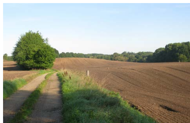
1. Ådalen set fra Fiskebækvej mod nord.