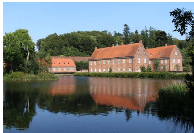
3. Tirsbæk Gods udgør et velbevaret kulturmiljø.

Tirsbæk Hovedgård og møllemiljø (Tyrsbæk), i dag kaldet Tirsbæk Gods, er kendt siden 1415. Godset ligger 500 meter fra Vejle Fjord i bunden af den dal, Tirsbæk løber i, og flankeres af skovene Kongeskov og Storskov. Tirsbækken er her stemmet op til en sø. Omkring godset er der alléer på mange strækninger. Hele godsets besiddelser med skove og agerjord indgår i en større landskabs- og kulturfredning, ligesom området er udpeget som kulturmiljø.