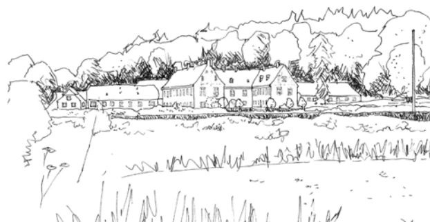
Tirsbæk Gods med det omgivende kulturmiljø ligger isoleret i dalen omkring Tirsbæk med udsigt til Vejle fjord.

Områdets særlige karaktertræk er de kuperede kystskrænter på nordsiden af Vejle fjord, bevokset med ældre løvskove og eroderet af vandløb. Omkring Tirsbæk Gods opleves et ret intakt herregårdslandskab med en oprindelig struktur af bebyggelse, veje, diger og hegn. Området rummer mange smukke udsigter over Vejle fjord og er synligt fra fjordens sydside.