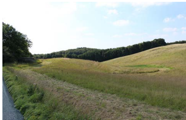
2. Kuperet landskab med dyrkede marker i områdets nordlige del med Tirsbækskovene i baggrunden.

De to vandløb, Ulbæk og Tirsbæk, skærer sig ned i de stærkt kuperede omgivelser. Ulbæk danner mod øst kommunegrænsen til Hedensted Kommune og dermed også landskabsområdets afgrænsning. Hvor Tirsbæk løber i fjorden, findes et lille område med marint forland med strandenge og Tirsbæk Strand.