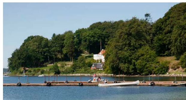
1. De skovklædte skrænter rejser sig over fjorden.