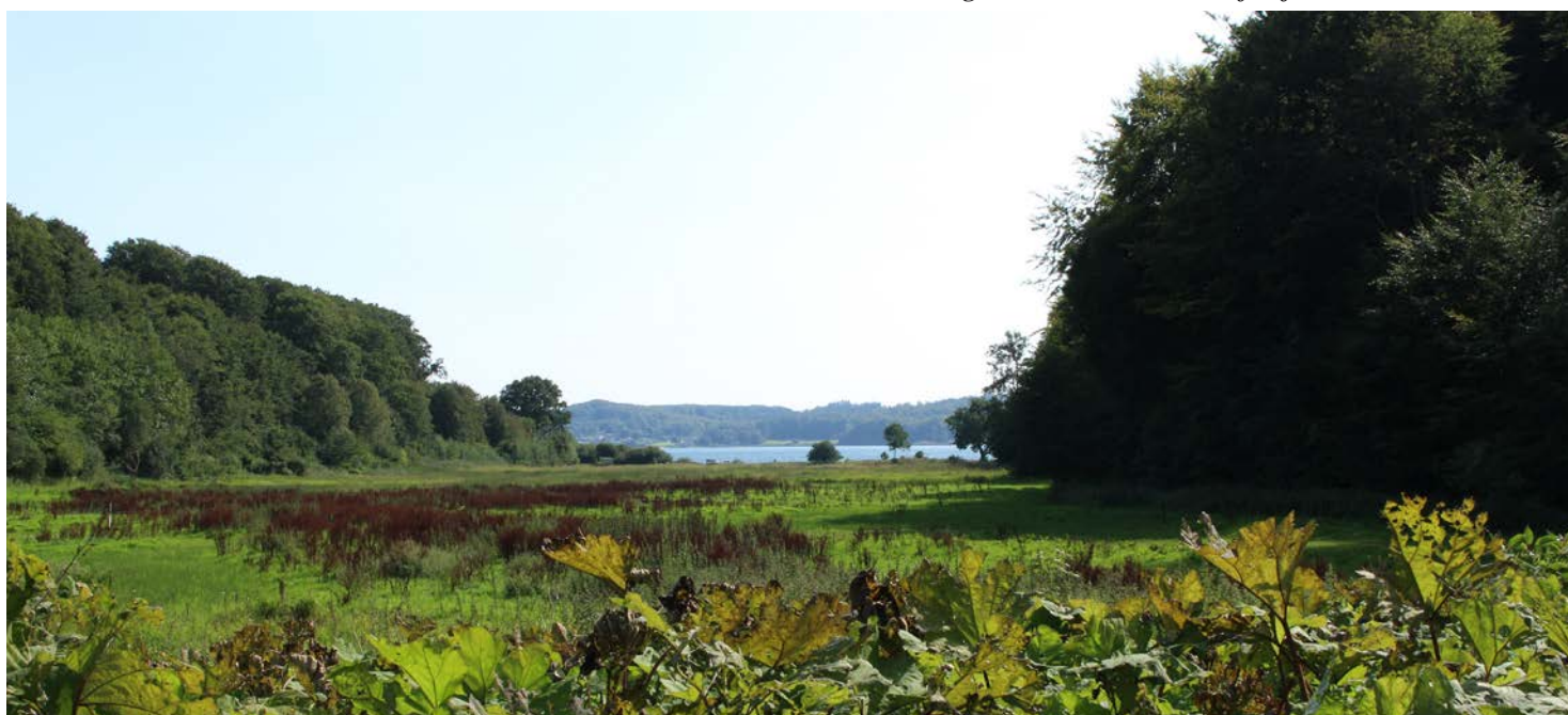
3. Kig fra Tirsbæk Gods mod Vejle Fjord.