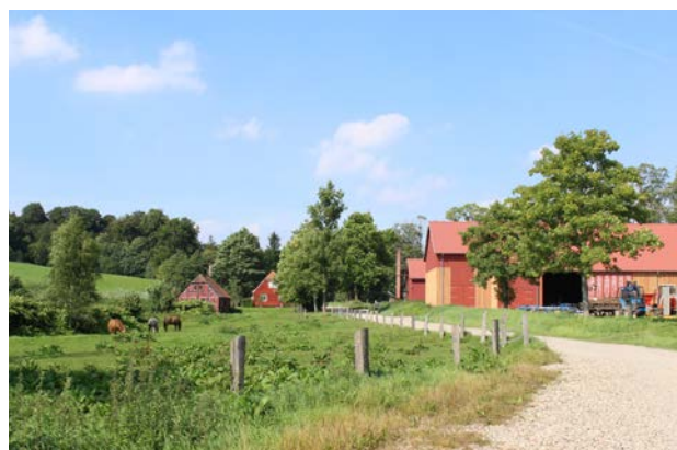
4. Herregårdsmiljø ved Tirsbæk Gods i det lukkede landskabsrum i ådalen omkring Tirsbæk.