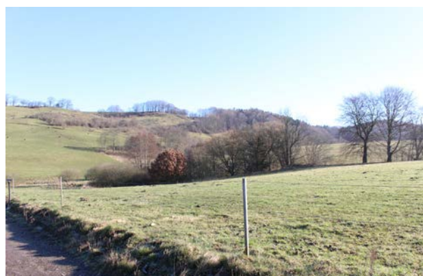
7. Udsigt mod nord fra Knabberupvej ved Overknabberupgård.