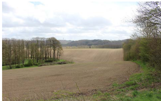
5. Kig fra Vardevej ved Kølholt mod syd over sandterrasser med ådalens skrænter bagved.