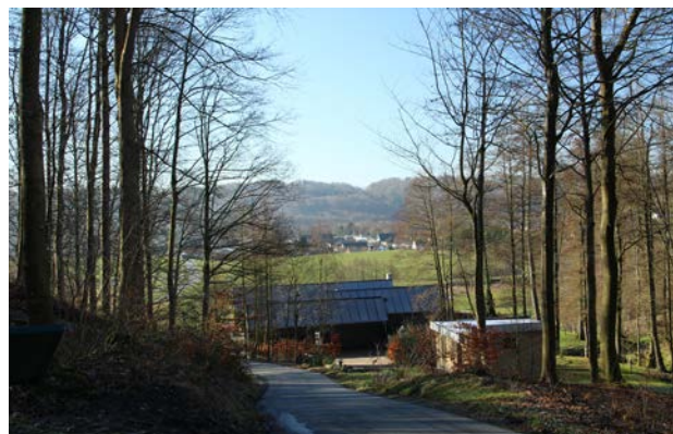
9. Ådalen set fra Østengård Skov