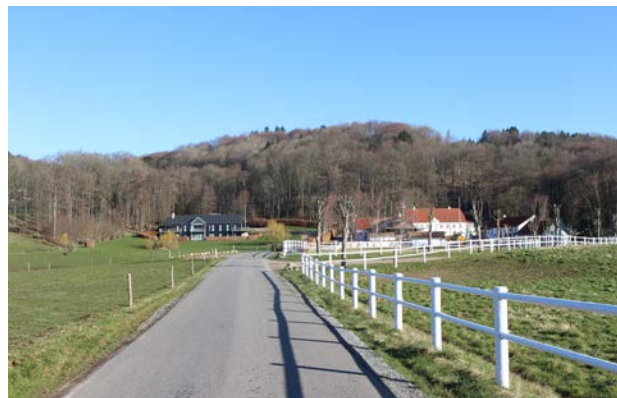
1. Kig mod skovbryn ved Østengård