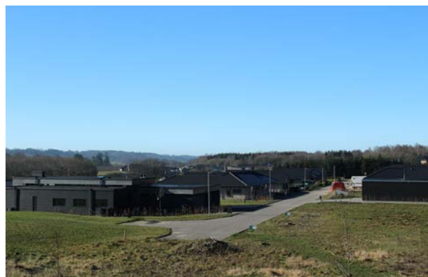
8. Parcelhusudstyknings ved Jennumvej