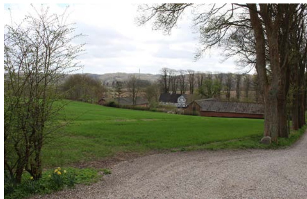
6. Udsigt mod gården Kølholt.

Mod syd afgrænses karakterområdet af Bredstenvejen der danner grænse til det naboliggende karakterområde for den flade dalbund som omfatter Vejle Enge og Vejle Å. Mod nord afgrænses området af dalsidens top mod det flade landbrugslandskab. Mod øst afgrænses området af Vejle By og mod vest af det mere urolige landskab omkring Kærbølling med dødisrelief og randmoræne.