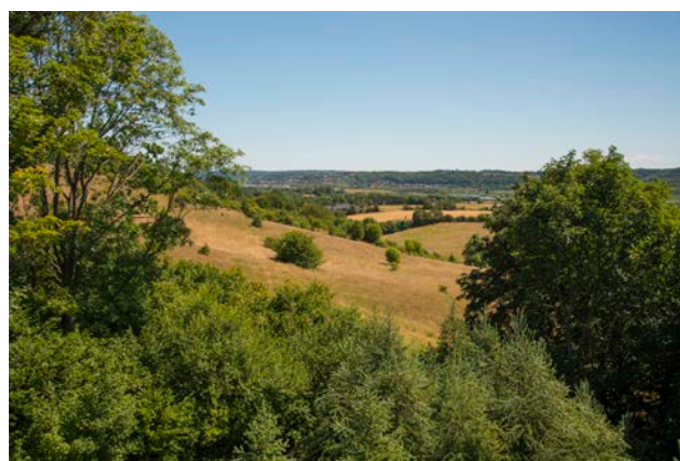
3. Udsigt fra Østengårdtårnet over overdrev og Kongens Kær