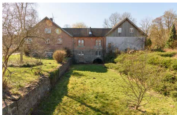
7. Haraldskær Fabrik med den tørlagte kanal