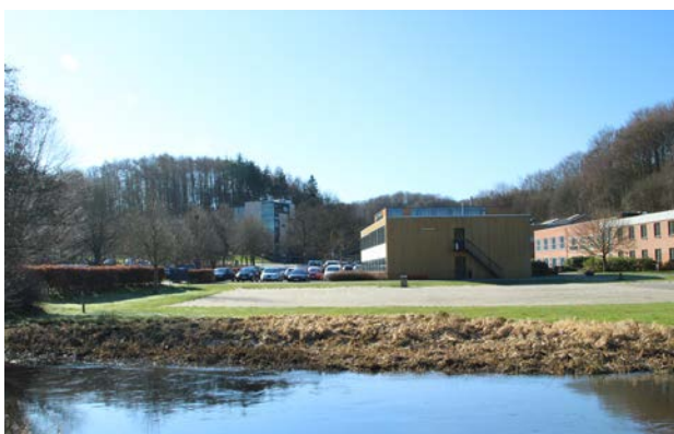
9. Vingsted kursussenter set henover åen.