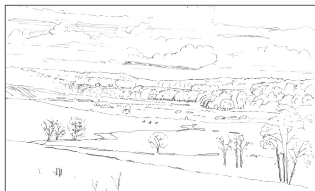
Skitse af ådalen set fra Skibetvej. Skovbrynet afgrænser landskabsrummet.

Områdets kulturmæssige karakteristika er overvejende præget af udviklingen omkring Haraldskær og Haraldskær Fabrik samt omkring Vingstedcentret gennem tiden. Generelt ligger landbrugsbebyggelsen som ådalsbrug ved ådalens terrasser i dødislandskabet eller på skrænternes irregulære bakker, enten som selvstændige gårde eller samlet som ved Kærboelling Huse