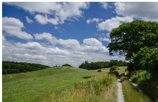
2. Vingstedvej ved Sødoværtærsklen

Nogle steder har ådalen skåret sig langt ned i ældre aflejringer, og her er der flere steder gravet kiselgur.