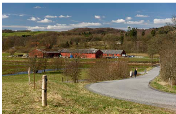
6. Avlsgården til Haraldskær set fra Ruevej

Herregården Haraldskær er kendt siden 1432, og området ligger med henholdsvis enge, overdrev og græsmarker omkranset af skræntskovene Haraldskær Skov, Ballegab Skov og Helligkilde Skov. Den bevaringsværdige hvidkalkede hovedbygning ligger på et svagt kendetligt firsidet voldsted i dalbunden. Hovedfløjen er opført i 1590 og gennem tiden er der bygget til. Umiddelbart nord for Hovedbygningen ligger Skibet Kirke, som hører med til ejerlavet. Skibet Kirke er en hvidkalket romansk kirke opført i frådsten, og fra den omgivende kirkegård er der god udsigt over ådalens terrænformer og landskab. 300 meter vest for hovedbygningen ligger den (ligeledes bevaringsværdige) rødkalkede ladegård, og lige nord for denne, ligger Kvak Mølle. Kvak Mølle var i 1600-tallet en kornvandmølle, men fra 1914 drev møllen turbine og elværk til Hovedbygningen. Møllebygningen ligger i dag som ruin, og ved mølledammen er der opført en større shelterplads.