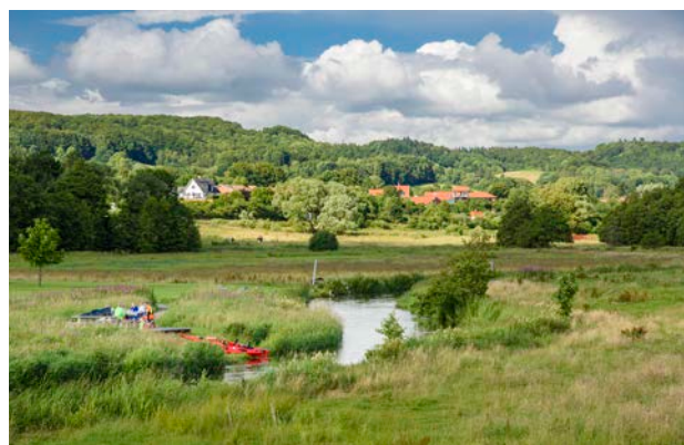
11. Kajakker ved Vejle Å ud for Skibet.