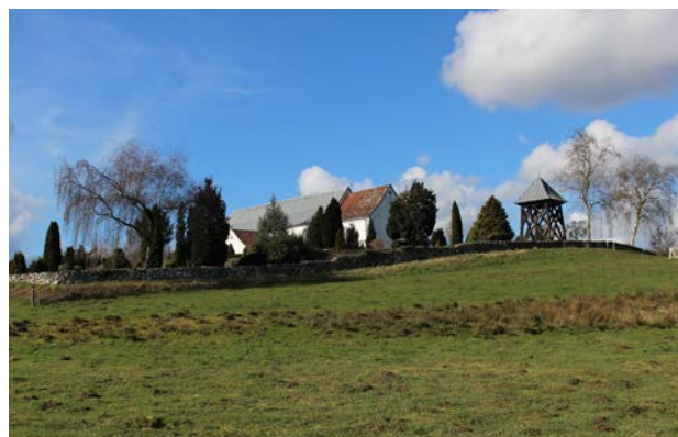
8. Skibet Kirke set fra øst