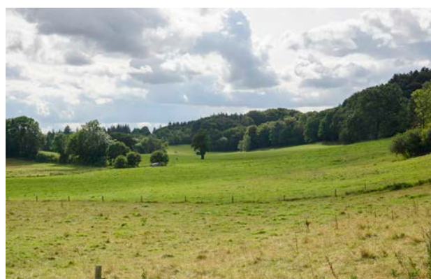
3. Udsigt fra Kærbølling mod vest.