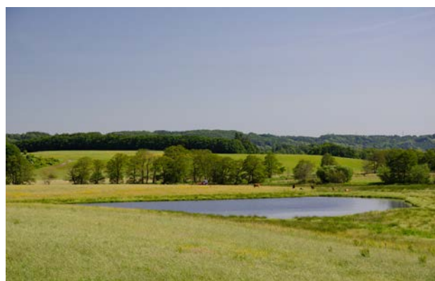
5. Elletræer ved vandløb øst for Haraldskær