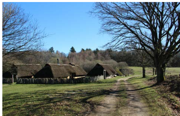
10. Jernaldermiljøet som er en del af Vingsted Historiske Værksted.

Landskabet opleves overvejende som stærkt karakteristisk med stærk sammenhæng mellem landskabets kulturgeografi og den naturgeografiske oprindelse.