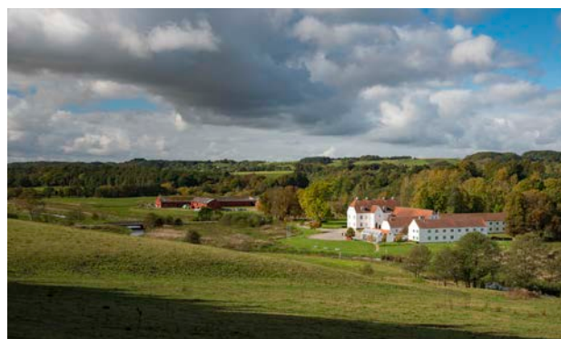
1. Haraldskær. Hvid hovedbygning og rød avlsgård.