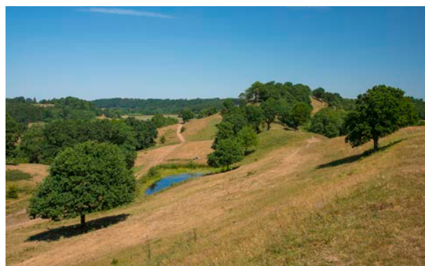
5. Den sandede bakkekam Runkenbjerg med sine naturrige overdrev.

Det forholdsvis rolige og åbne landskab kan let overskues fra de mange udsigtpunkter rundt omkring, og landskabet vurderes samlet at være af middel skala, omend det kuperede område ved Tørskind lokalt er et landskab af lille skala. De mange udsigter gør, at landskabet er særlig sårbart for forandringer i tilstødende landskabsområder.