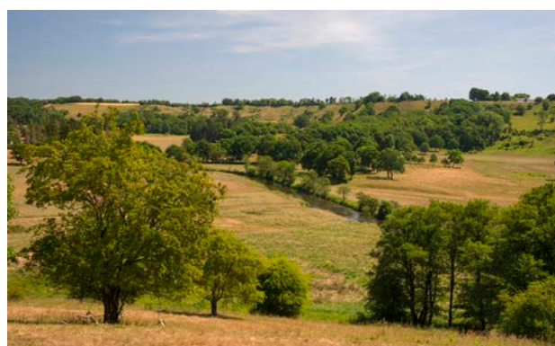
6. Udsigt fra Runkenbjerg mod syd over Sønderkær og Vejle Å umiddelbart nedstrøms at Egtved Å og Vejle Å er løbet sammen.