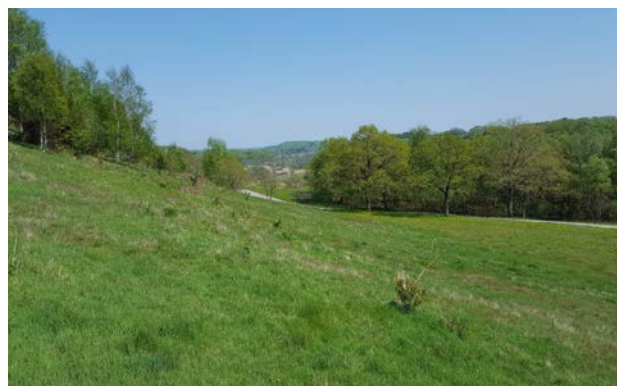
8. Kig mod nordøst over Tørskindvej.