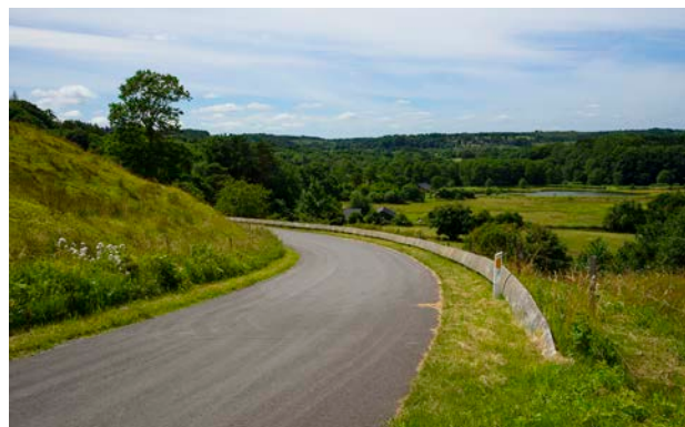
7. Udsigt fra Refsgårde over dambrugsmiljøet ved Egtved Å. I baggrunden ses det tilstødende landskabsområde Egtved Ådal.