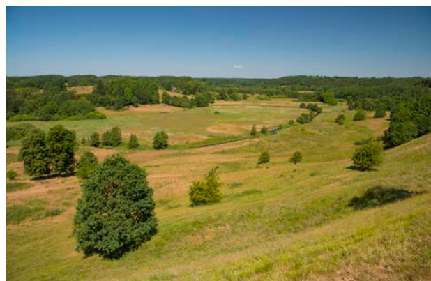
4. Udsigt fra Runkenbjerg mod nordvest med Vejle Å's forløb i dalbunden.