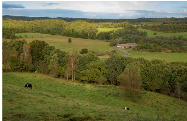
2. Udsigt fra Tørskind Grusgrav over Tørskind med Klingebækgård liggende centralt.

I Sønderkær og på de omkringliggende banker og skrænter findes både overpløjede gravhøje og en stor koncentration af velbevarede jægerstenalderboplader. Øst for Lokkesbjerg på sydsiden af Vejle Å, ligger voldstedet Kolborg, og i tilknytning hertil, et vadested. De mange kulturspor vidner om stor aktivitet i området gennem historien.