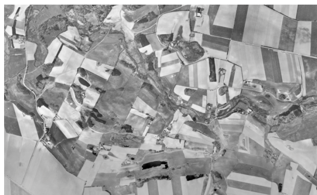
3. Mange små åbne og opdyrkede lodder. Luftfoto fra 1954.