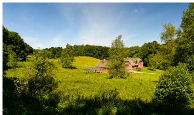
5. Bebyggelsen ligger delvist gemt i de små lukkede landskabsrum.