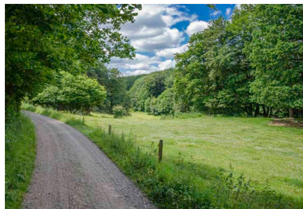
1. Små lukkede landskabsrum præger oplevelsen ved Vork Bakker.