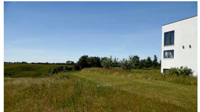
6. Moderne bolig i Ødsted på kanten af ådalen, som udgør den sydlige del af området.

Den sydligste del af området er et smalt bånd omkring Ødsted Bæk og Ammitsbøl Bæk. Denne del af området opleves mere åbent og mindre roligt, da det påvirkes af krydsende asfaltveje og af boligområdet i den sydlige del af Ødsted.