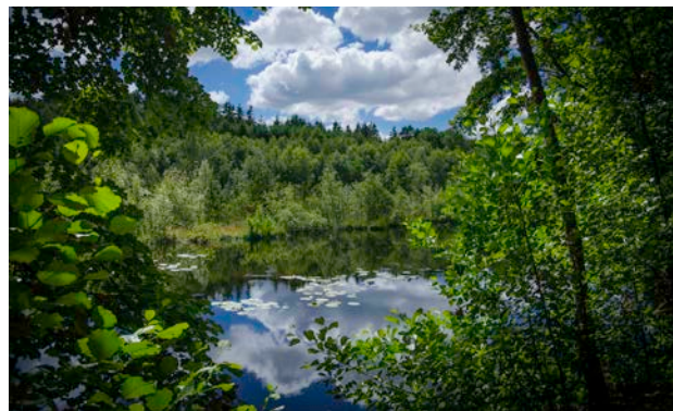
2. En af Vork Bakkers mange tørvemoser i en lavning dannet af dødis.

Vejstruktur og struktur i bebyggelse, diger og hegn kan findes tilbage på høje målebordskort (1868-69) og er sandsynligvis meget ældre.