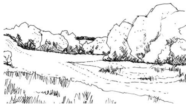
Småbakked dødislandskab er karakteristisk for området.

Landskabet mellem Ødsted og Vork er kendetegnet ved det stærkt karakteristiske og småbakkede landskab. Landskabet opleves som lukket med små rum omkranset af beplantning og med mange mindre søer og moser. Skalaforholdet er småt, og derfor er landskabet meget sårbart overfor nye anlæg, som er af stor skala.