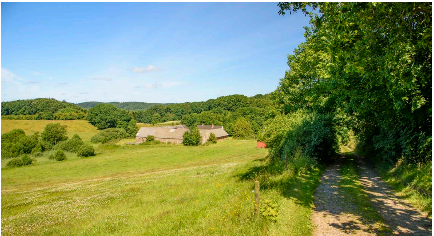
7. Mindre gårde og boliger ligger uforstyrret i små rum i det kuperede terræn.