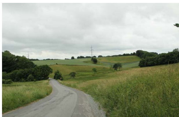
7. Kuperet terræn i en slugt vest for Fårup Sø set fra Ollerupvej mod syd.