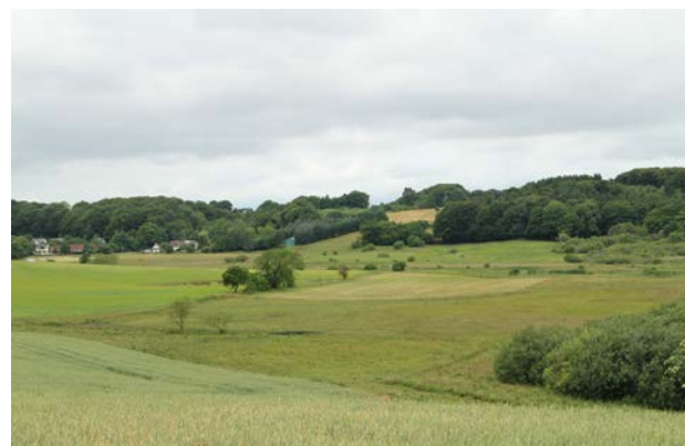
1b. Udsigt over tunneldalen øst for Fårup Sø set mod nordvest