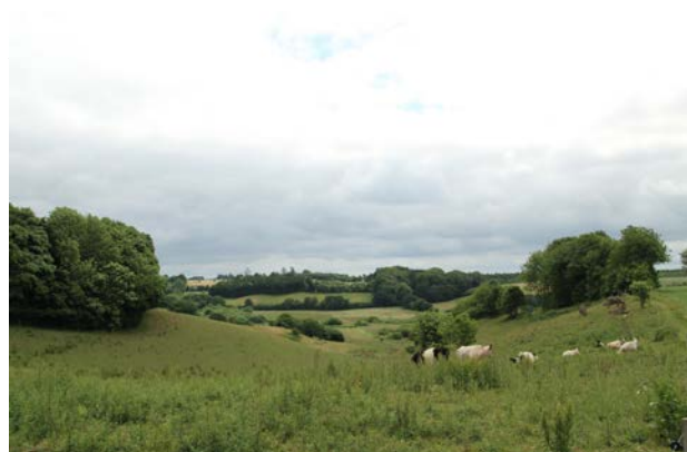
2. Udsigt fra de kuperede skrænter ved Ollerupvej mod Ollerup Kær.

Fårupgård på nordsiden af søen er en gammel herregård, som i dag drives af Vejle Kommune som ungecenter. Langs Fårupgårdvej nord for herregården findes en husmandsudstykning, som er udstykket fra Fårupgård først i 1900-tallet.