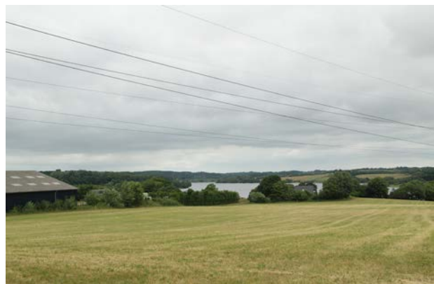
6. Fårup Sø set mod nord. Her krydses tunneldalen af højspændingsledninger.

Området krydses sydvest for Fårup Sø af højspændingsmaster, men opleves ellers ret uforstyrret med små snoede veje og spredte mindre gårde.