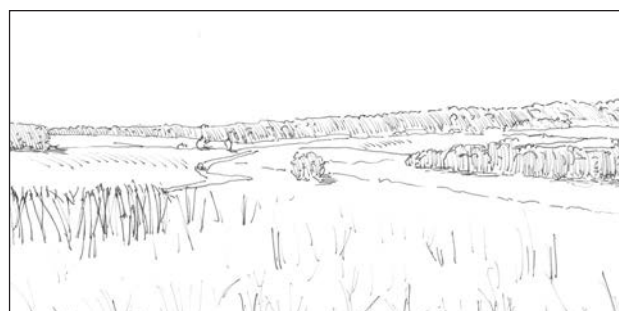
1a. Udsigt på tværs af dalen mod nordvest fra Skovdallundvej.

Landskabets nøglekarakter er tunneldalen, som danner et afgrænset landskabsrum med kuperede skrænter og flad dalbund. Landskabet har karakteristiske mønstre og strukturer af åbne naturlige enge og kær i dalbunden, selvstændige små til mellemstore bebyggelser som 'putter' sig i det bakkede dødislandskab eller på skrænterne, tydelige gamle skræntskove på nordsiden, møllemiljøer og kildevæld samt spor af kildekalkgrave bl.a. ved Jelling Skov.