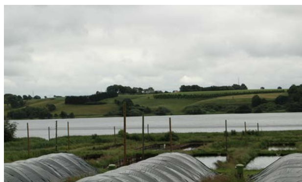
3. Fårup Mølle Dambrug på nordsiden af søen.