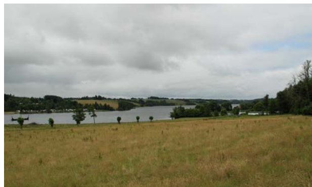
5. Fårup Sø på bunden af tunneldalen, set fra Skovdallund mod sydvest. På modsatte bred ses campingpladsen.