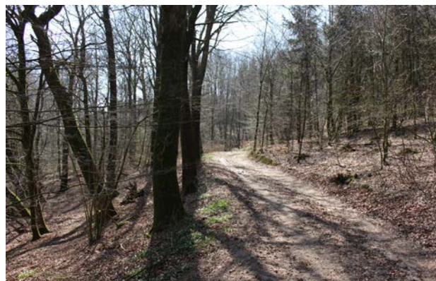
4. Skovvej på dalkanten i Holmskov set mod syd.