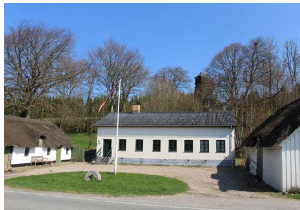
1. Bølling Mølle ses bag møllegården og træer.

Vejene er overvejende små og følger landskabet. Dalsiderne er de fleste steder udlagt til græsning, men der er også mindre skræntskove og bevoksninger.