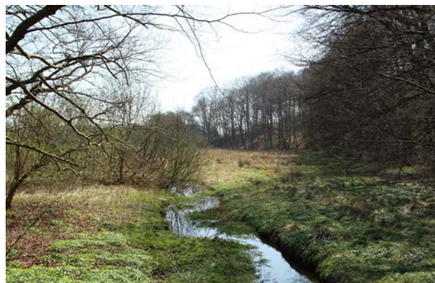
3. Ådal ved Holmskov set mod øst.