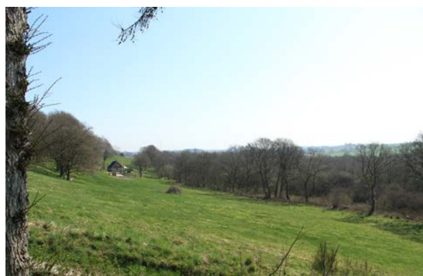
2. Den nordlige side af dalen omkring Bølling Bæk set mod øst.