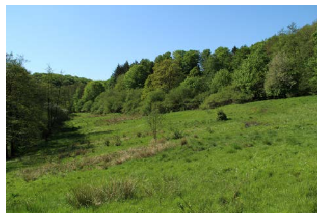
1. Ådalens landskabsrum har en lille skala og afgrænses af skrænter og skove.