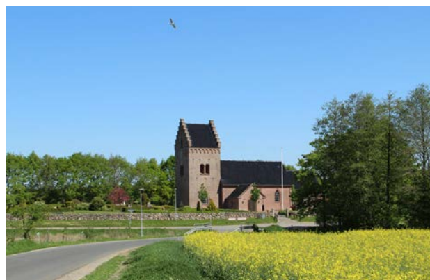
4. Højen Kirke ligger i områdets vestligste udkant, ved Højen Å vest for Ny Højen.