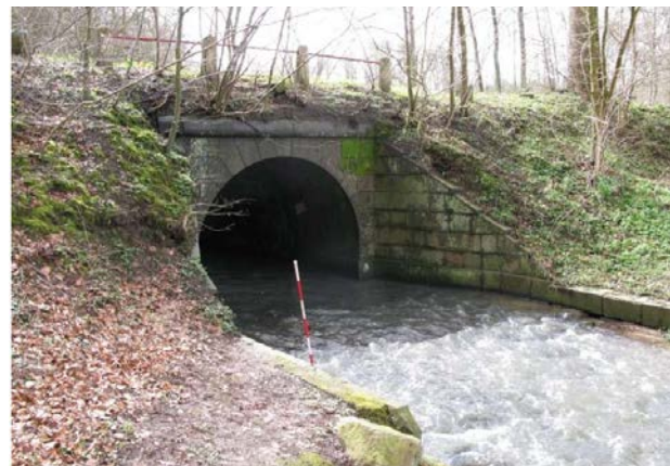
3. Fredet bro under Gl. Koldingvej