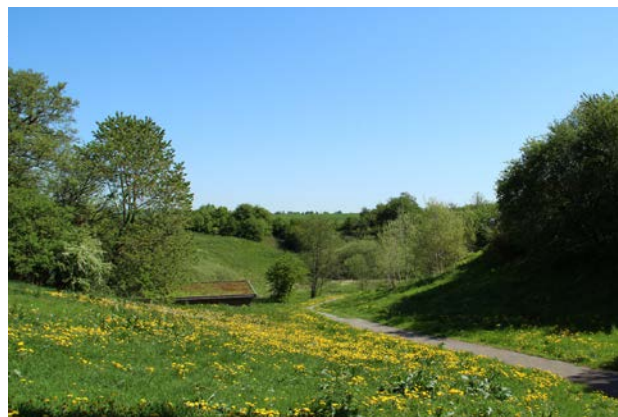
5. Ved Ny Højen har ådalen forholdsvis flade skrånninger. Her løber en sti fra Ny Højen ned til åen gennem en mindre sidedal.

Ådalen opleves generelt uforstyrret af tekniske anlæg og fungerer som et bynært, rekreativt område for de tilgrænsende boligområder. Kun de to krydsende landeveje forstyrrer roen. Ved Ny Højen præges ådalen visuelt af byranden, som følger ådalens sydlige kant tæt.