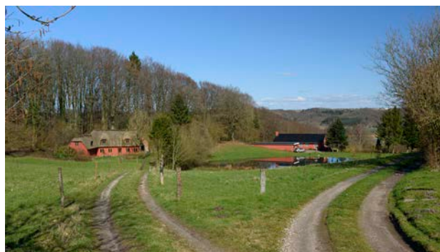
7. Enkelte steder er der kig til Vejle Ådal fra den nordligste del af området.