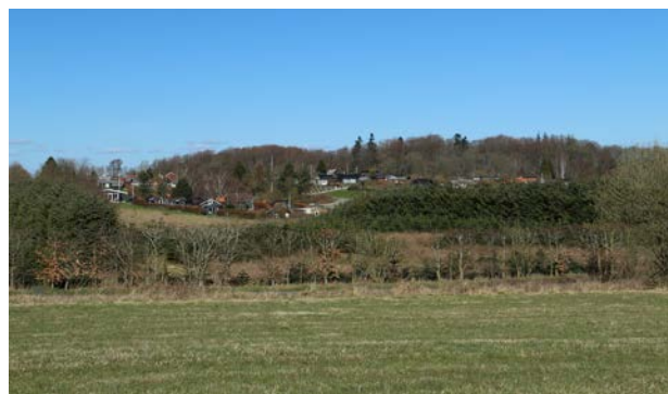
5. Kolonihaverne ved Sandagergård ses her med skræntskoven ned mod Vejle Ådal i baggrunden og et af de nyere tilplantede områder forrest.