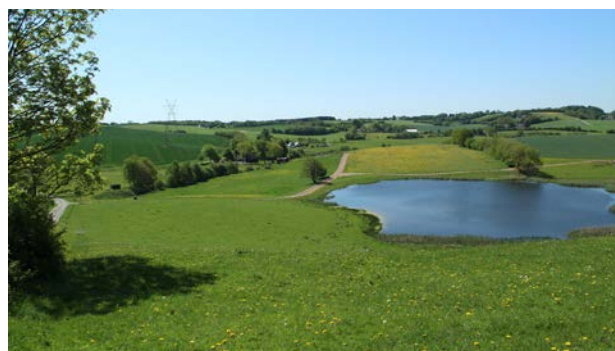
3. Hvor dødisen har efterladt lavninger i terrænet, findes vandhuller og små søer.