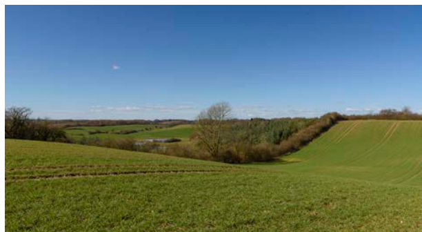
2. Levende hegn i markskel understreger terrænets kurver.

Jordbunden består primært af moræneler med mindre områder med ferskvandsaflejringer i lavningerne. Syd for Nørre Vilstrup findes et lidt lavere liggende område omkring Møgelbæks forløb mod Vejle Ådal, hvor der er aflejret smeltevandssand.