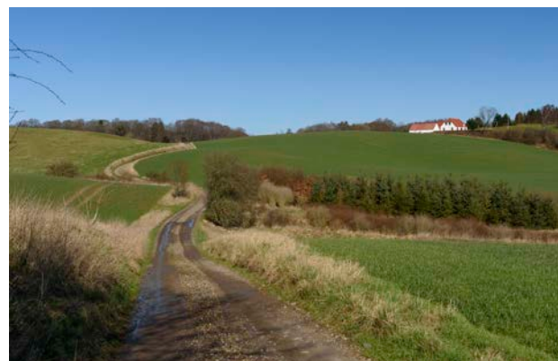
1. Landskabet kendetegnes ved det småbakkede terræn med dyrkede marker, spredte gårde og smalle, snoede veje.