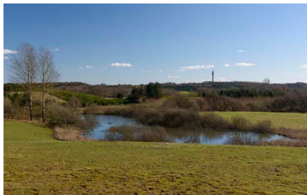
6. Det småbakkede landskab med vandhuller i lavninger er karakteristisk. TV-tårnet i Gl. Højen, som ses i baggrunden, er synligt fra store dele af området.

Den visuelle kontakt ud af området er generelt begrænset til de nærmeste tilgrænsende områder. Enkelte steder i den nordligste del er der kig gennem skræntskoven til Vejle Ådal.