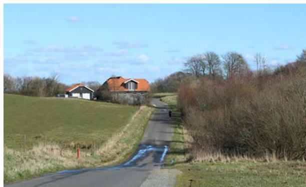
4. Landskabet kendetegnes ved spredte gårde og smalle veje, som følger terrænet.

Ved Sandagergård i den nordlige del af området findes et mindre kolonihaveområde, som er etableret omkring 1975.