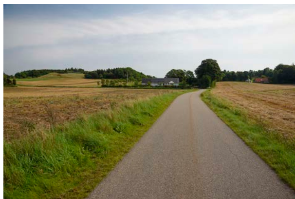
6. Kig mod de få bebyggelser langs Bavnevej, set mod øst.

Der er ikke tekniske anlæg af betydning i området, men på Bavnebanke og Helmesbanke står to mindre, ældre vindmøller. Der bør ikke etableres yderligere tekniske anlæg i området.