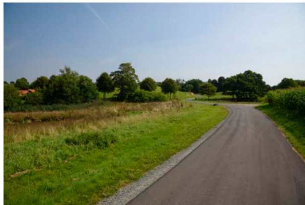
2. Kig mod eng, sø og mose omkring Smidstrup Bæk og syd for Vester Smidstrup.

Der er rester af sten- og jorddiger i området fra stjerneudstyking af Vester Smidstrup, men strukturen fremstår ikke længe-re tydeligt i landskabet.