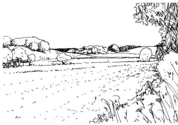
Udsigt over det bakkede landskab med Himmelpind til højre.