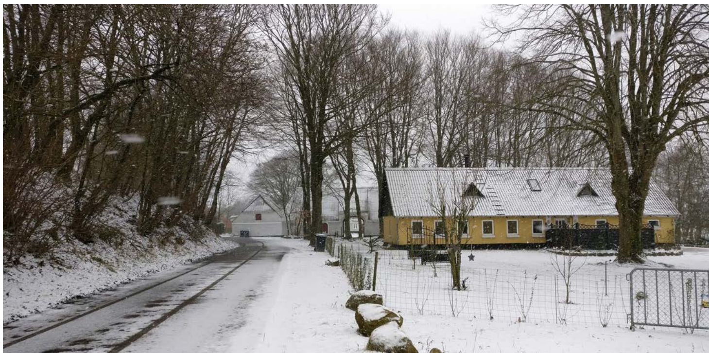
9. Landsbyen Vester Smidstrup er placeret, så den følger foden af bakken. Husene ligger som en række mellem den markante bakke og Smidstrup Bæk.