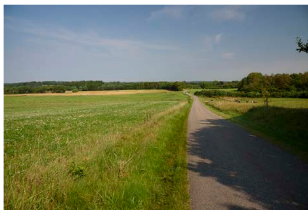
7. Kig fra Nedvadvej over det forholdsvis åbne og flade landskab nord for Lindeballe.