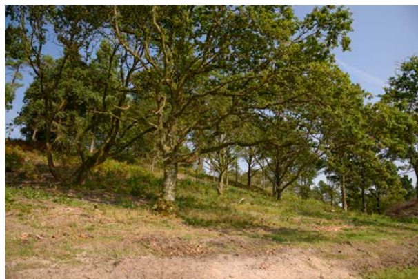
3. Rydning af busk og træer ved Buskebanke. Store egetræer står tilbage.