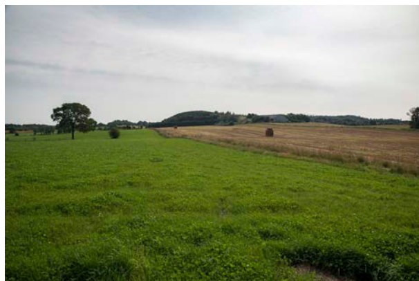
5. Bavnegård har taget navn efter den markante Bavnebanke.