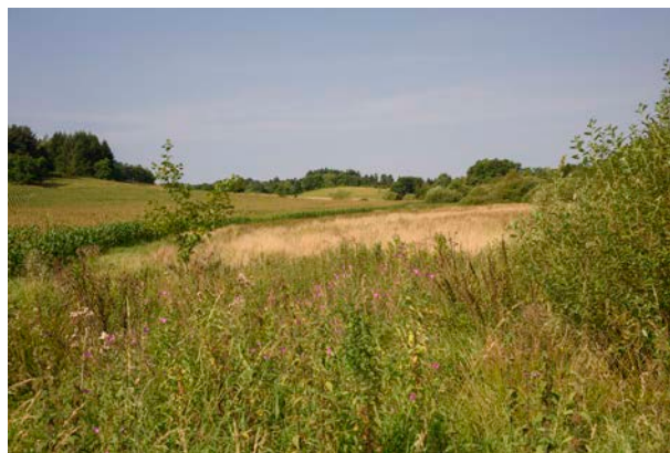
8. Lindeballe Bæk med højdedraget Havnsbjerg i baggrunden, set fra Bredsten Landsvej mod nord.