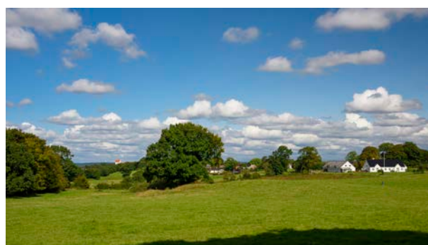
7. Kig fra Åstvej mod Lindeballe, hvor Lindeballe Kirke ses mod vest.