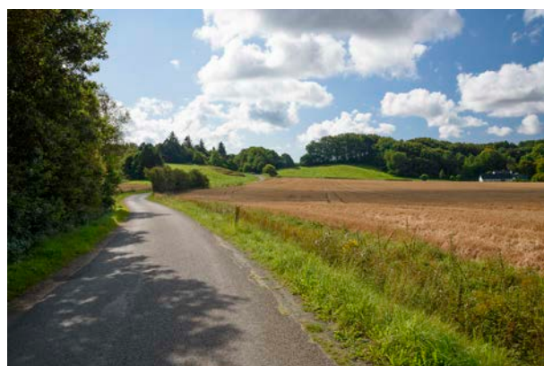
3. Fra Førstballevej og vest på er dalbunden bred, flad og opdyrket.