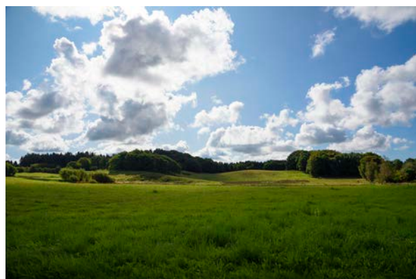
4. Brandås og Grydedals Banker.

Der har tidligere været gravet mange tørvegrave i områdets lavbundsarealer, men områdets relativt høje andel af dyrkede landbrugsarealer har med tiden drænet eller opfyldt flere af disse, hvorfor tørvegravning i dag fremstår som et svagt karakteristisk spor i landskabet.