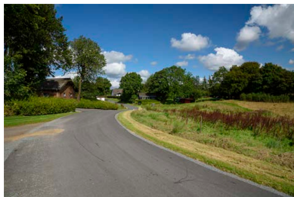
9. Mørup set fra syd.