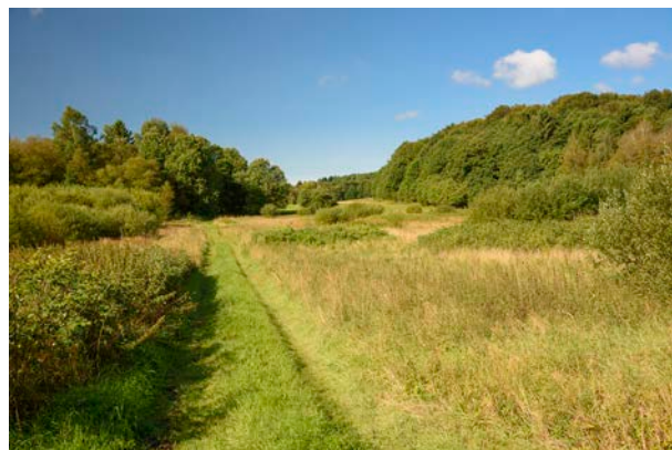
2. Rostrup Mose ådalen er tilgroet og med fugtig bund.

De høje bakker er sandsynligvis dannet som randmoræne ved isens hovedopholdslinje, mens dalen er dannet af smeltevand.