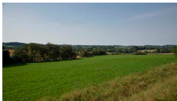
1. Kig over landbrugslandskab med ådalen Bindsbøl Bæk sydvest for Lindeballe.