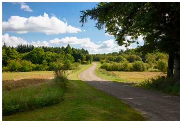
6. Lysning mellem Åst Skov og Lindeballe Skov.

Området gennemskæres af flere hærvejsforløb, og flere steder langs hærvejen ligger større koncentrationer af eksisterende eller overpløjede gravhøje.