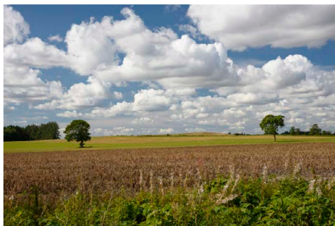
10. Udsigt over landskabet sydvest for Åst.