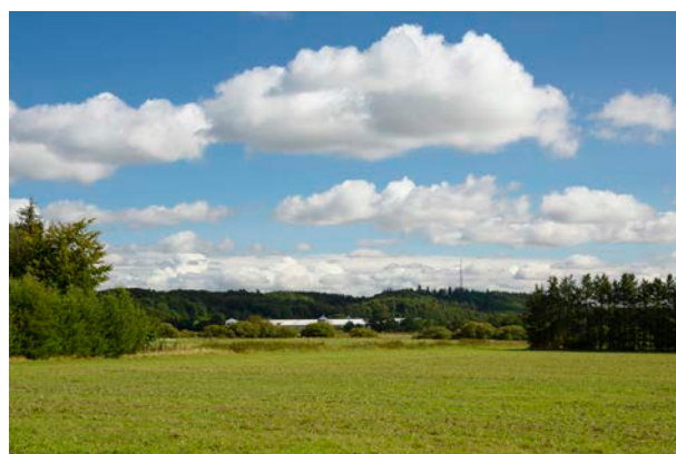
5. Større landbrugsbyggeri og tekniske anlæg i dalbunden.