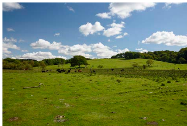
8. Damgårds Eng og Assendal Banke.

Af tekniske anlæg findes en telemast, samt nord-sydgående højspændingsledninger ved Møllebjerg og et meget stort gård-anlæg ved Baldershøve. Der bør ikke etableres yderligere tekniske anlæg i området, som opleves relativt uforstyrret.