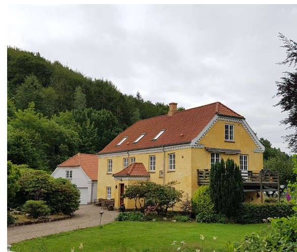
Grejs Nedre Mølle