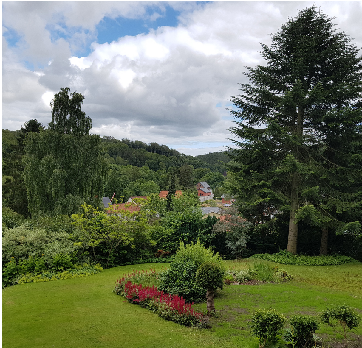
Udsigt fra Bøgeagervej