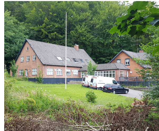
Bøgeagervej 6. tidl. kemisk fabrik