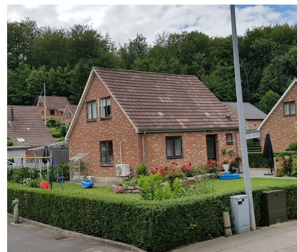
Huse på Nytoft