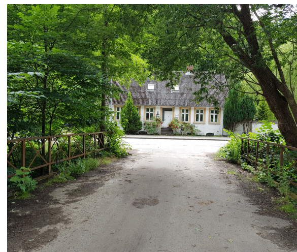
Stationsbroen og Grejsdalsvej 375

Wittrups Uldvare- og Klædefabrik blev grundlagt 1895 af Vejle Dampmøllens ejer til fabrikation af byggryn og bygmel. Senere omdannet til fabrikation af havregryn, Avena Havregryns mølle. Den bestod af en villa og en fabriksbygning, opført 1895. Der er sluse