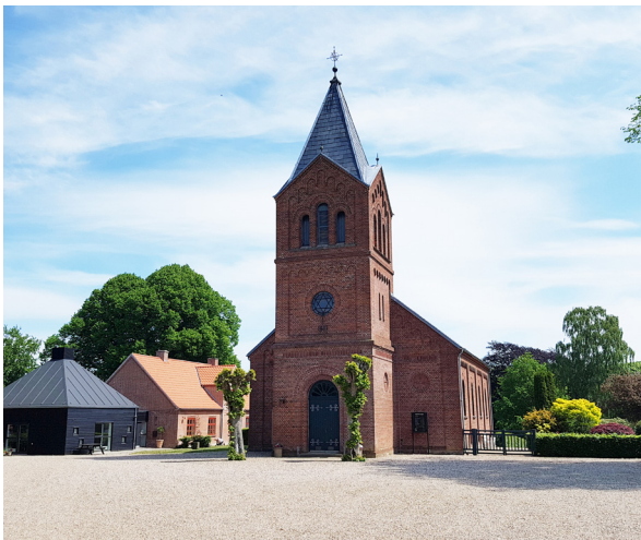
Frimenighedskirke og præstebolig

Ågård kendes siden 1524. I 1688 var det en mellemstor landsby med 15 gårde og 4 huse beliggende langs bygaden på hver side af Vester Nebel Å. Landsbyen blev blokudskiftet i 1774-75 hvorefter ganske mange gårde flyttede ud på deres lodder. Syd for åen, bag kroen (vgl. privilegeret 1777), opstod i slutningen af 1800 tallet et grundtvigiansk fri- og højskolemiljø. Nord for åen omkring rytterskolen udfyldtes hullerne fra de udflyttede gårde efterhånden af andelstidens bymæssige funktioner.