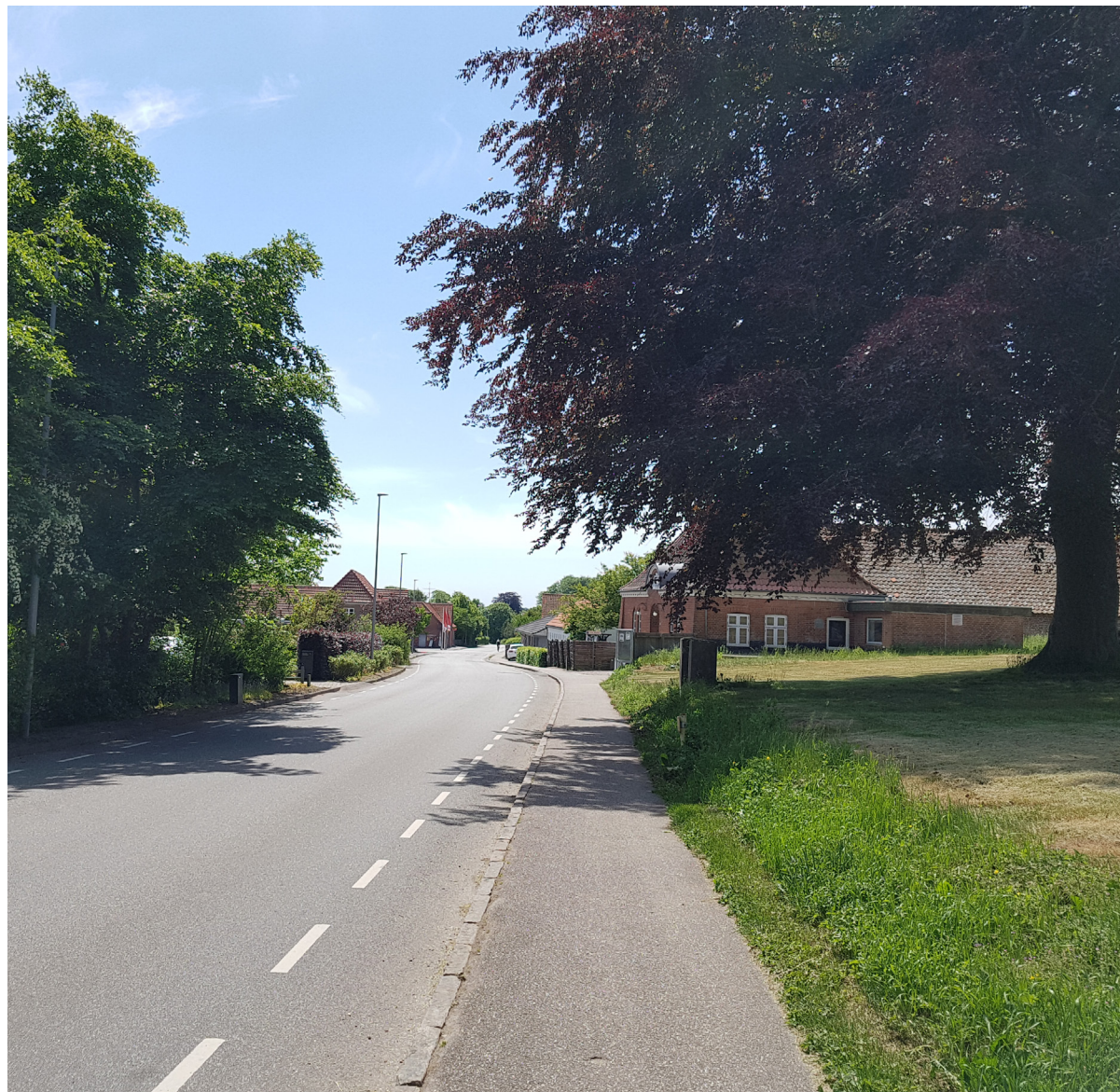
Bramdrupvej set mod syd. Til højre, blodbøg i haven til Ågård Mølle og forsamlingshuset