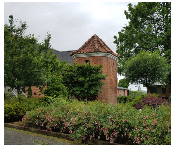
Klokketårn til efterskolen