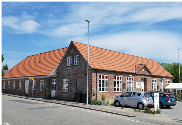
Rytterskolen med tilbygning