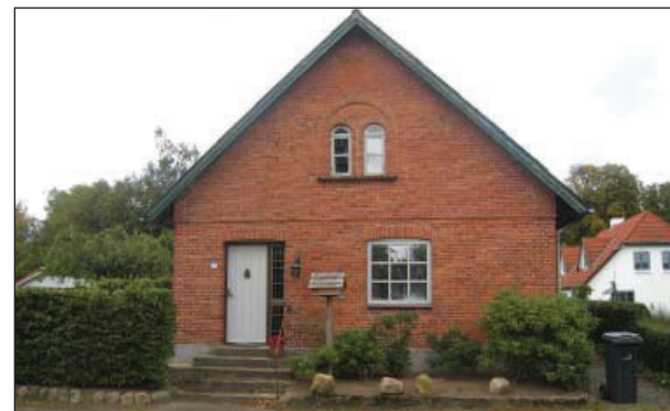
Typisk gadehus med gavlen mod vejen.

Dog må der opføres ny bebyggelse til erstatning for bebyggelse, der nedrives, såfremt omfang og placering er uændret, ligesom der må opføres mindre tilbygninger til eksisterende bygninger. Haver kan udstykket, medmindre det modsatte er angivet på kortet.