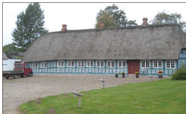
Stuehuset på Ødegård