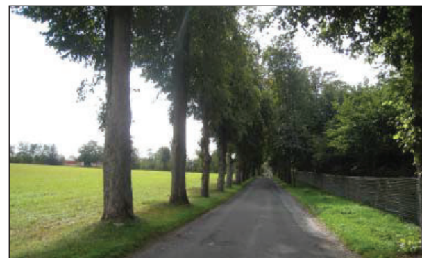
Alléen foran Egeland