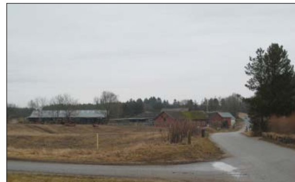
Indkørsel fra nord