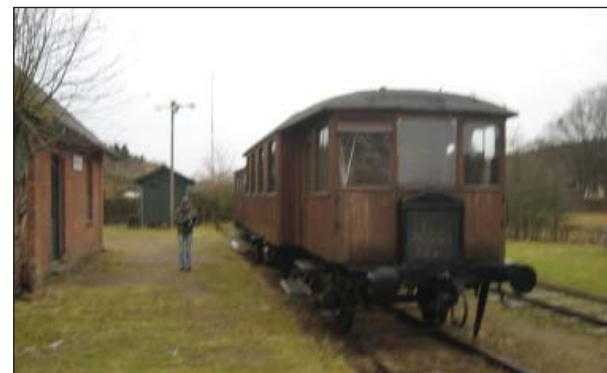
Motortoget ved stationen

Dog må der opføres ny bebyggelse til erstatning for bebyggelse, der nedrives, såfremt omfang og placering er uændret, ligesom der må opføres mindre tilbygninger til eksisterende bygninger. Haver kan udstykkes, medmindre det modsatte er angivet på kortet.