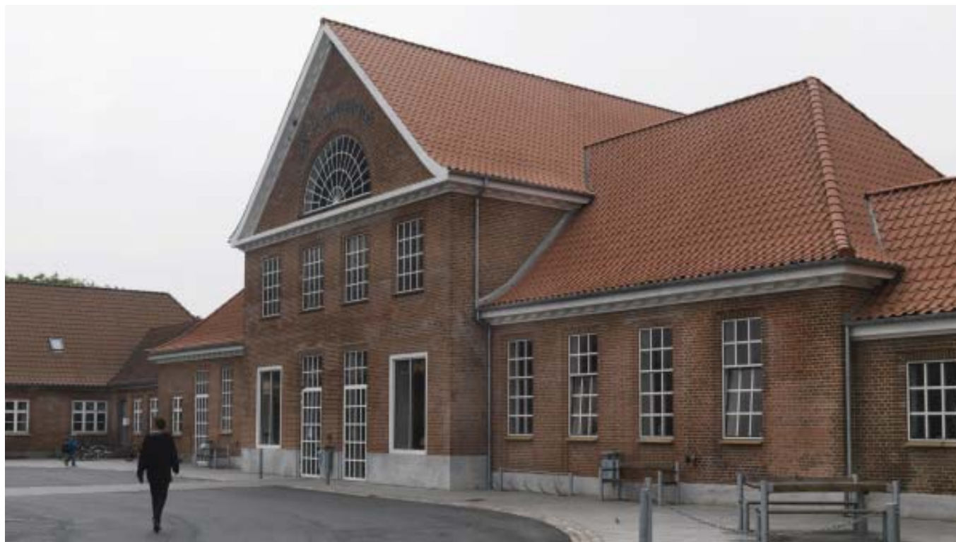
Det istandsatte FASTER Andelsmejeri i landsbyen Astrup

En liste over kontaktpersoner og foreninger i landsbyerne kan ses på www.lokalsamfund.vejle.dk