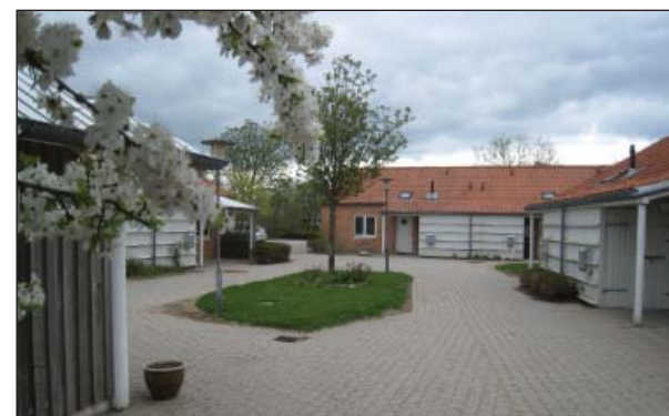
Nyere bebyggelse af ældreboliger