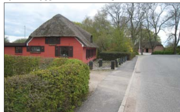
Engumvej set mod præstegården