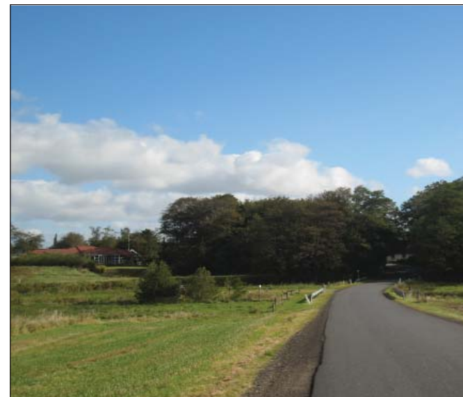
Ankomst til Farre fra sydvest ved broen over Omme Å