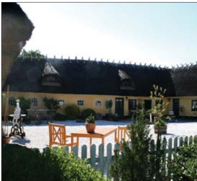
Galleriet, Ågade 15