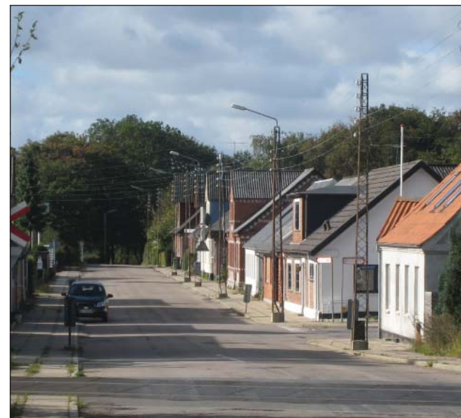
Ågade set fra Jernbaneoverskæringen