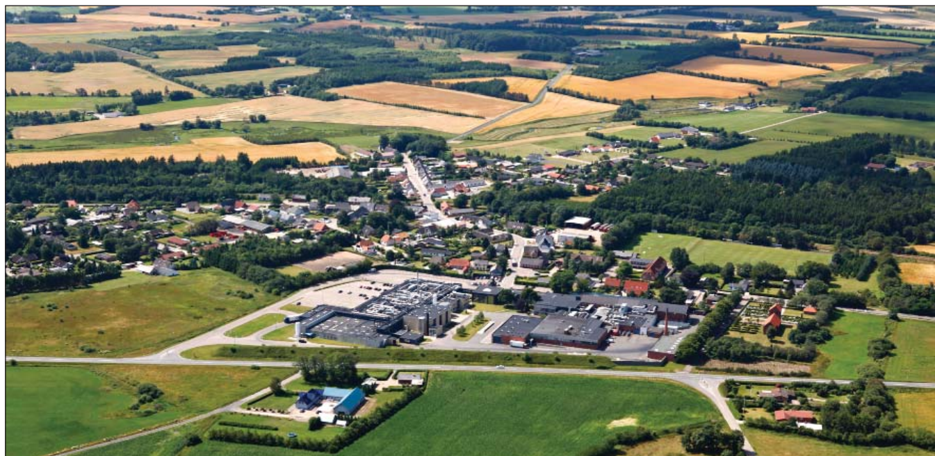
Farre set luften. I forgrunden hovedvejen og Lantmännen Danpo.

Det er derfor vigtigt at bevare disse bygninger og sikre, at de får en ny funktion. Mejeriet har indtil for få år siden været anvendt til autoværksted, men står nu tomt. Bortset fra to nyere porte i facaden er det ret velbevaret.