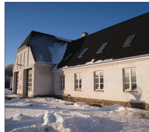
Mejeriet opført 1928. Senere autoværksted.

Uden for bykernen er der flere parcelhusudstyknings og en udstyknings af "storparceller". Der er en del ubebyggede byggegrunde i byen.