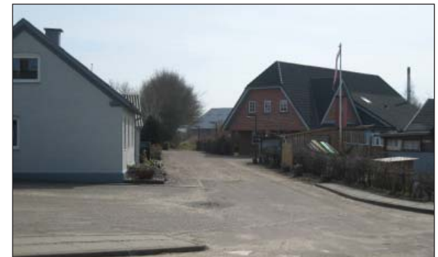
Østerled set mod øst