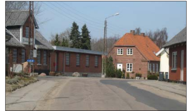
Hovedgaden med Hovedgaden 32 i baggrunden

Da landsbyen har en ny skole og idrætshal, kan der ske en vis udbygning.