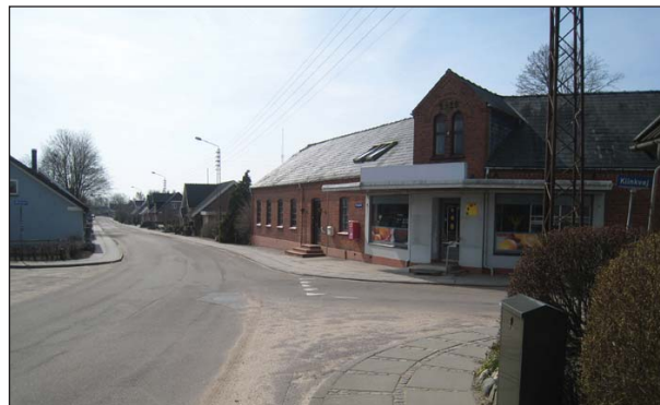
Hovedgaden ved Østerled set mod syd