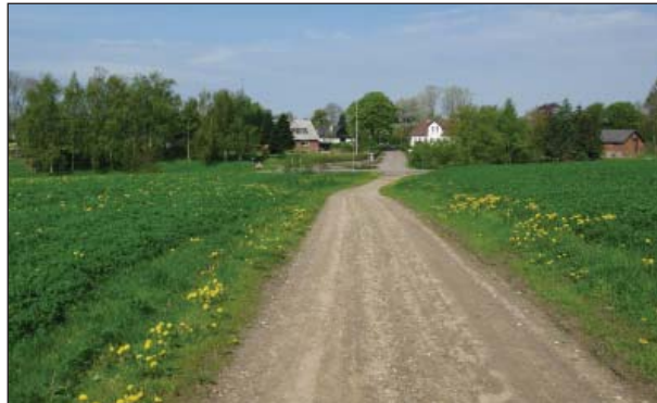
Landsbyen set fra Fidalvej

Der bør ikke ske nogen udbygning af landsbyen.