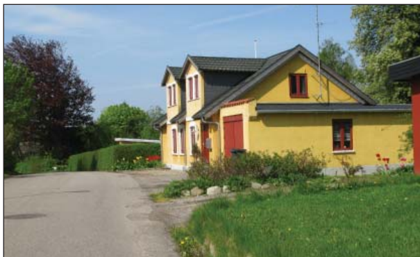
Gl. Hornstrupvej 113