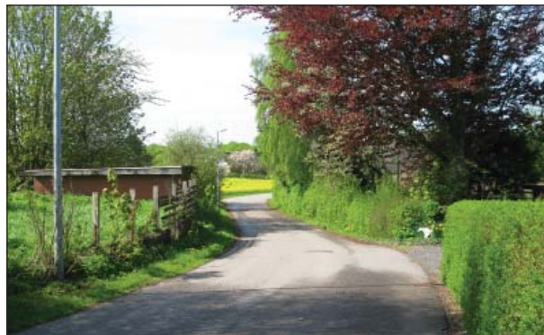
Gl. Hornstrupvej set mod vest