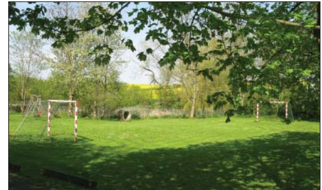
Grønt område med gadekær