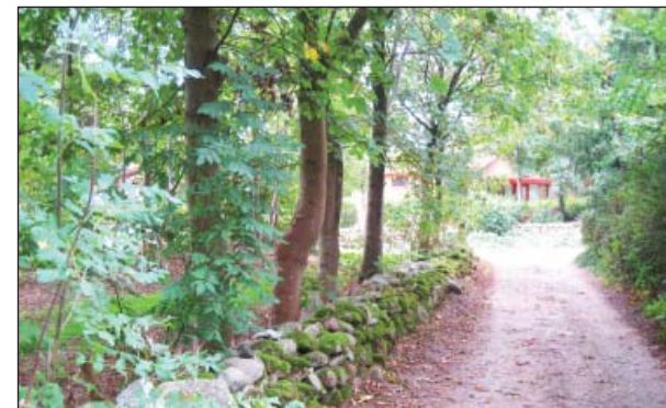
Stengærde i indkørsel