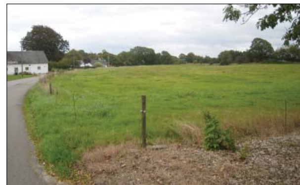
Kontakt til landskabet øst for Brugsen