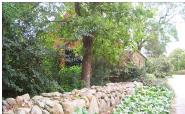
Stengærde foran den gamle skole

Dog må der opføres ny bebyggelse til erstatning for bebyggelse, der nedrives, såfremt omfang og placering er uændret, ligesom der må opføres mindre tilbygninger til eksisterende bygninger. Haver kan udstykkes, medmindre det modsatte er angivet på kortet.