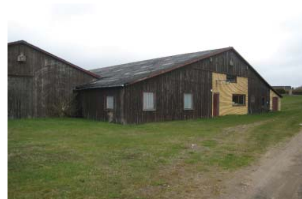
Lagerhal på det tidligere baneterræn

Dog må der opføres ny bebyggelse til erstatning for bebyggelse, der nedrives, såfremt omfang og placering er uændret, ligesom der må opføres mindre tilbygninger til eksisterende bygninger. Haver kan udstykkes, medmindre det modsatte er angivet på kortet.