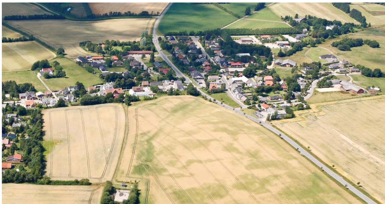
Kollemorten set fra luften, mod vest. Det tidligere banetrace kan anes i kornmarken.

Stationsbygningen findes endnu, men dens oprindelige byggestil er ændret en del og den er i dag omkranset af parcelhuse. Den ligger på Banevænget 20.