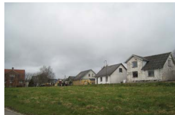
Restareal ved Kollemortervej