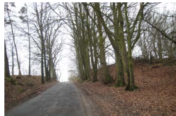
Hærvejen nord for Kollemorten