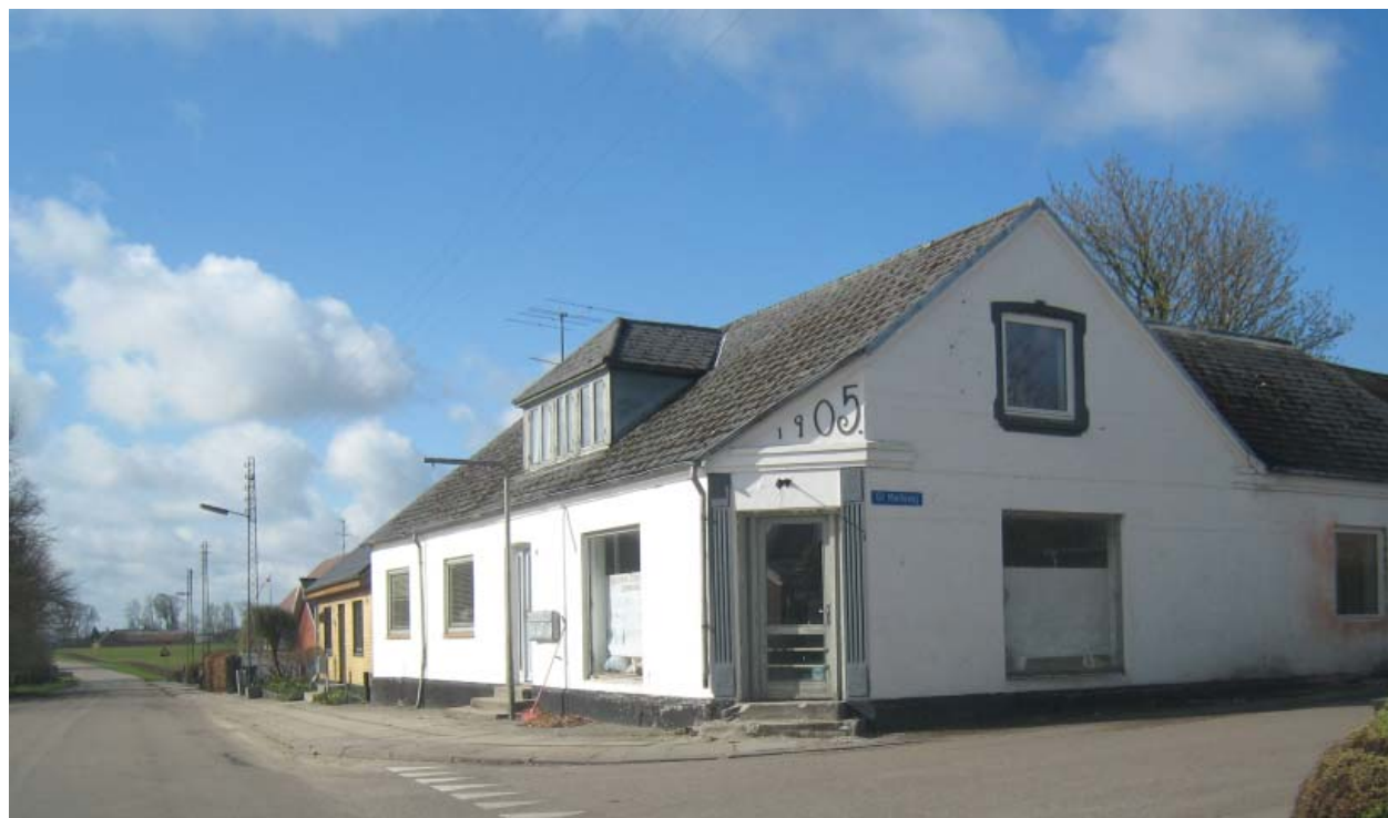
Tidligere butik på hjørnet Hærvejen / Møllevej