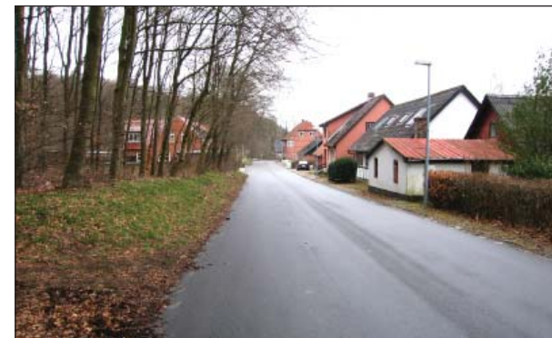
Ahornvej set mod øst

Dog må der opføres ny bebyggelse til erstatning for bebyggelse, der nedrives, såfremt omfang og placering er uændret, ligesom der må opføres mindre tilbygninger til eksisterende bygninger. Haver kan udstykkes, medmindre det modsatte er angivet på kortet.