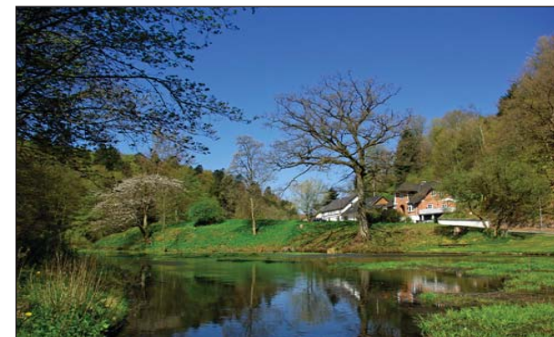
Opstemningen ved fabrikken