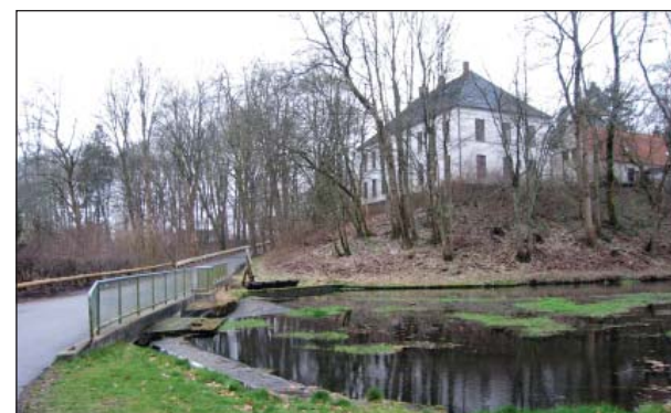
"Det Hvide Palæ"