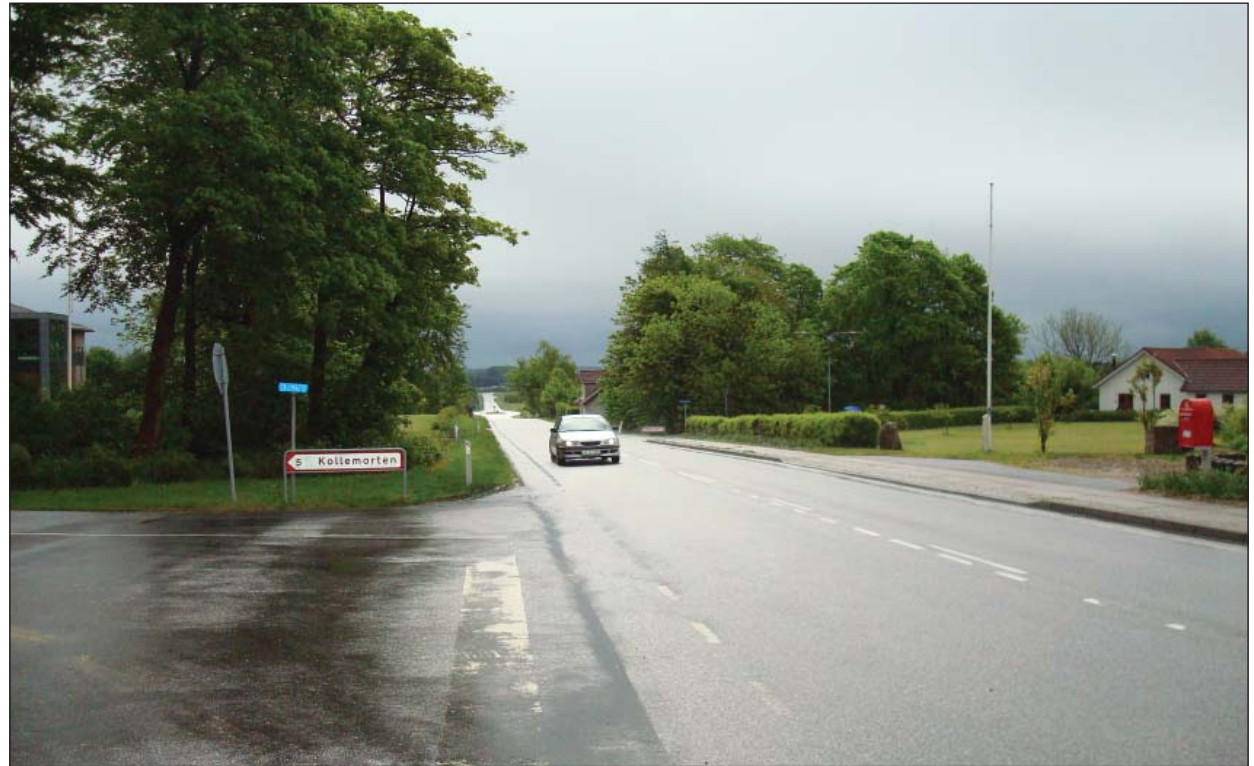
Vejlevej set mod syd