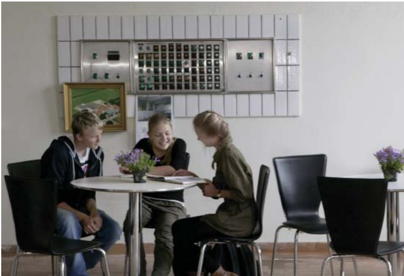
Lektiecafe i det gamle mejeri