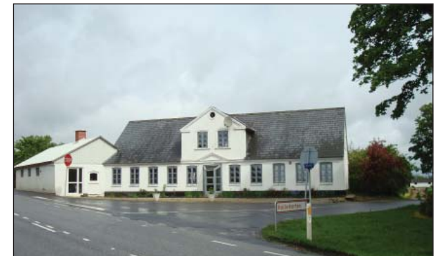
Den tidligere kro