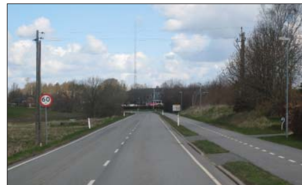
Vongevej ved Engvej, set mod nord

Dog må der opføres ny bebyggelse til erstatning for bebyggelse, der nedrives, såfremt omfang og placering er uændret, ligesom der må opføres mindre tilbygninger til eksisterende bygninger. Haver kan udstykkes, medmindre det modsatte er angivet på kortet.