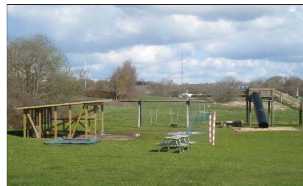
Grønt område ved bæk